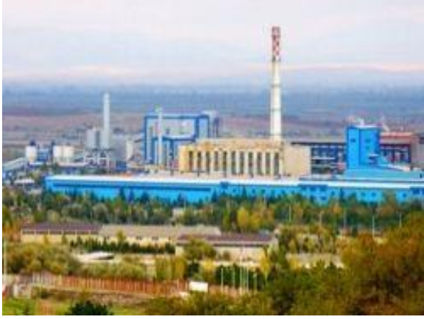
Seydişehir Alüminyum Fabrikası

Seydişehir'in sanayi yapısı Alüminyum Fabrikası ile önem kazanmaktadır. İlçede marangozlar ve diğer iş yerlerini kapsayan iki ayrı sanayi sitesi bulunmakta olup, Marangozlar Sanayinde 150 iş yeri, diğer sanayi sitemizde 180 işyeri bulunmaktadır. İlçe merkezinde 1 un fabrikası, 1 un-bulgur-kuru gıda paketlenme fabrikası, 3 yem fabrikası, 1 plastik malzeme, 1 tuğla fabrikası, 1 konfeksiyon ağırlıklı işletme, 3 Alüminyum soğuk döküm fabrikası mevcuttur. Ketenli kasabasında faaliyet gösteren 1 buğday nişasta fabrikası ile Ortakaraören kasabamızda 1 un fabrikası, 1 süt mamulleri fabrikası ilçenin ekonomik boyutunda önem arz etmektedir.